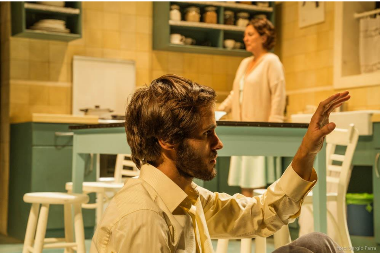
La Abadía - "He nacido para verte sonreír"